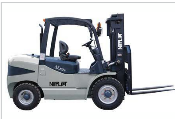
4 t - 5 t Diesel Forklifts

müşteri temsilcilerimizle irtibata geçiniz. for detailed information about diesel forklifts